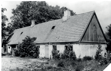
"Den gamle skole", lige før nedrivning, Foto ca. 1960.