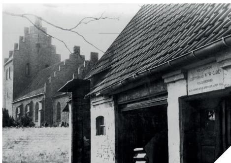
"Den gamle skole", var beliggende øst for Reerslev kirke, Foto ca. 1960.

personlige bohøve, skulle sælges på auktion og gøres i penge.